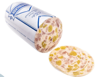
Champignon Aufschnittwurst halb