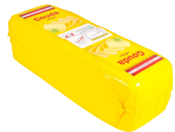
Gouda 3kg 45% F.i.T mit Milch aus der EU