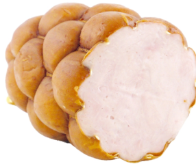
Kitzbüheler Putenschinken ganz