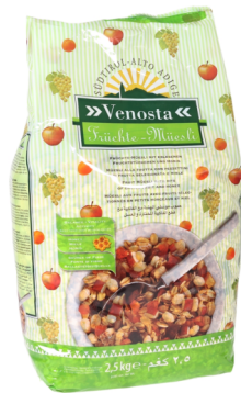
Früchtemüsli Venosta 2,5kg Beutel