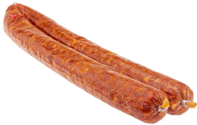
Salami Napoli 2 Stk