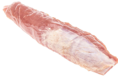
Schweine Filet ohne Kopf frisch 5er