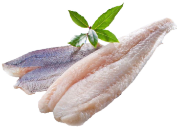
Kap Seehechtfilet 10% Glasur TK 170-230g m.Haut Karton Merluccius capensis/paradoxus / 03047411