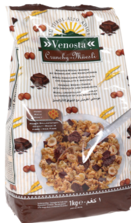
Knuspermüsli Schoko Nuss Venosta 1kg Beutel