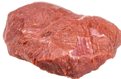
Argentinien Steakhuf zugeputzt frisch