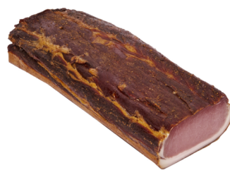
Karreespeck Landler ohne Schwarte vac