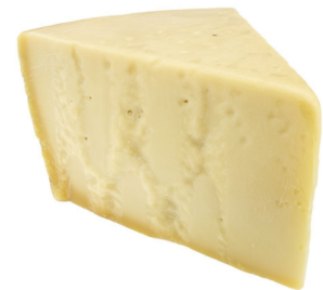
Parmesan Grana Padano 2kg Zwickel 32% F.i.T mit Milch aus der EU