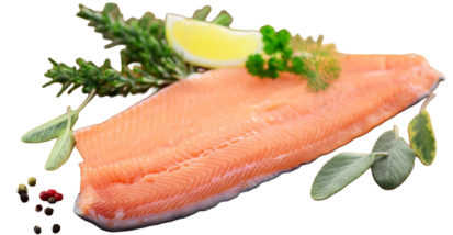
Lachsforellenfilet 10% Glasur TK 170-230g Oncorhynchus mykiss / 03044210