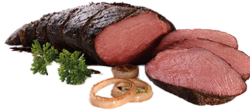
Sous Vide R.Schultermeisl ca.2kg