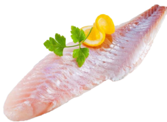
Rotbarschfilet TK 160-180g o.Haut Karton Sebastes alutus / 03048929