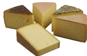
Heumilchkäse Sortiment Vorarlberg ca 3,7kg, Blümle-, Tomatino-, Rahm-, Senner-, Bergkäse mit Milch aus Österreich