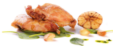
Sous Vide Kaninchenkeule 6stk/pack TK 1,1-1,5 kg