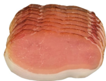
Karreespeck geschnitten 500g Landler