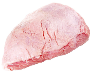
Kalb Tafelspitz frisch