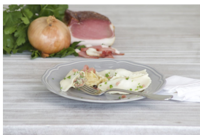
Schlutzkrapfen mit Speck TK 30g 100 Stk Dengg