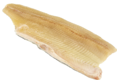
Saiblingsfilet 10% Glasur TK 150-250g Salvelinus alpinus / 03048910