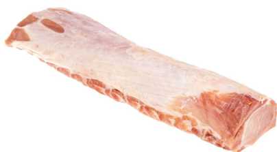
Schweine Karreerose pariert frisch ganz ca. 3,5kg