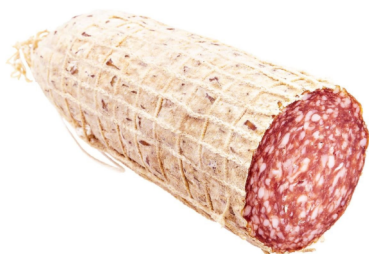
Salami Milano ca 1,5kg