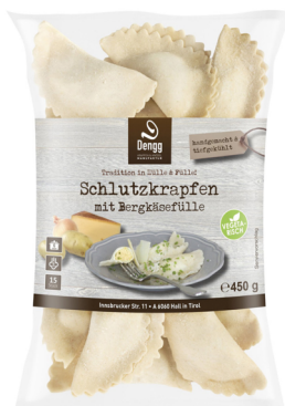
Schlutzkrapfen mit Bergkäse TK 30g 100 Stk Dengg