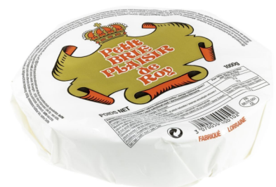
President Brie 1kg 60% F.i.T. mit Milch aus der EU