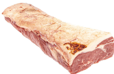
AT Stier Beiried ohne Kette frisch ganz vac