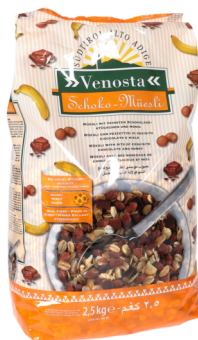
Schokomüsli Venosta 2,5kg Beutel