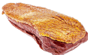
Entenbrust geräuchert frisch