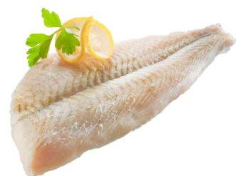
Schollenfilet TK 120-170g Karton Lepidopsetta polyxystra / 03048390