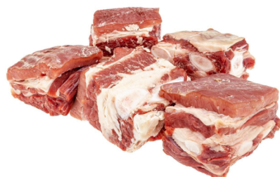
AT Stier Beinfleisch TK