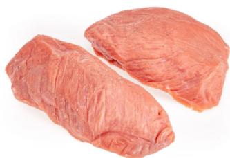
Kalb Steakhufte gevliesst geteilt frisch